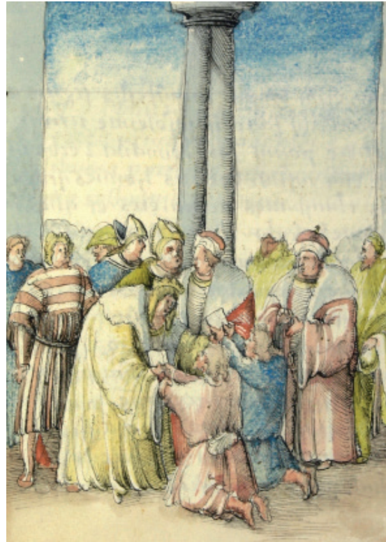
Bildnachweise: Konferenzzimmer des Prinzen Eugen von Savoyen, Kupferstich (J. B. Propst, S. Kleiner, ÖNB Bildarchiv und Grafiksammlung, 214940-C). Joseph Grünpeck, Historia Friderici III. et Maximiliani I. (HHStA HS B 9 fol. 76r).